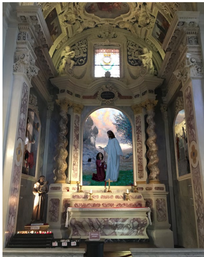
Projection des tableaux dans la Chapelle

Banque: Caisse d'Épargne Côte d'Azur - Arenas