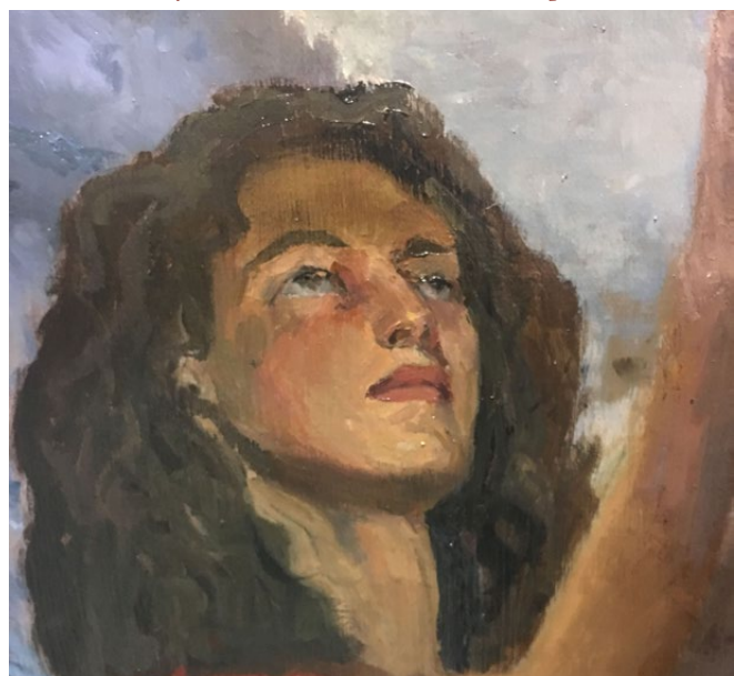
Détail du visage de Marie-Madeleine (tableau central)